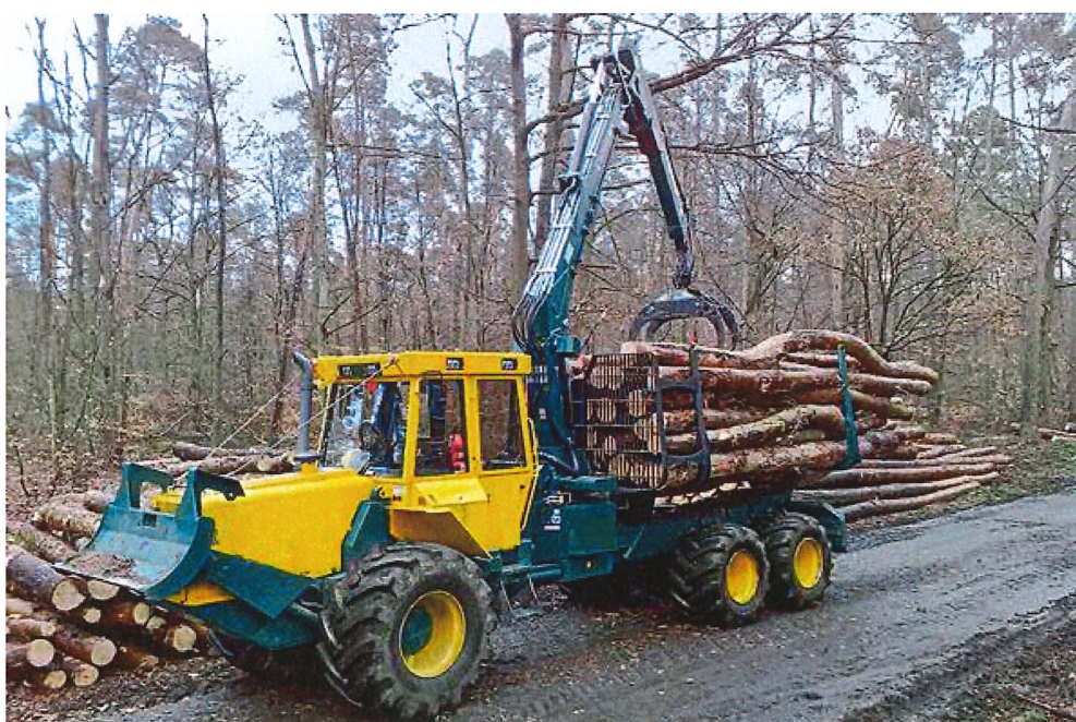
Illustration du type de tracteur forestier souhaité

L'actuel tracteur forestier, demeure une machine particulièrement bien adaptée aux interventions en zone urbaine ou dans des terrains exigeants tels que la Vallée du Gottéron. Ce dernier restera en service à raison d'environ 200 heures par an et sera utilisé lors de travaux spécifiques, notamment des coupes de bois ou la réalisation de prestations ponctuelles pour des tiers.